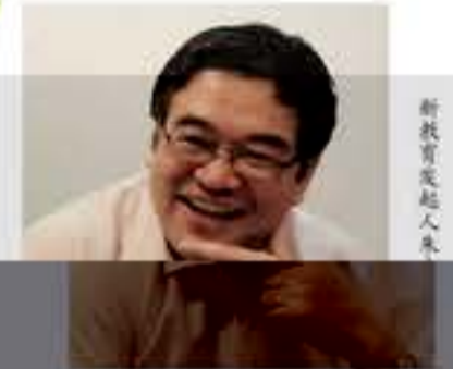
朱永新，男，1958年生，江苏大丰人，研究生学历，博士学位，苏州大学教授，博士生导师，现

“新教育实验”的教师发展 专业阅读，教师专业发展的基石 专业写作，在反思中成长 专业发展共同体：打造教师成长的生态环境